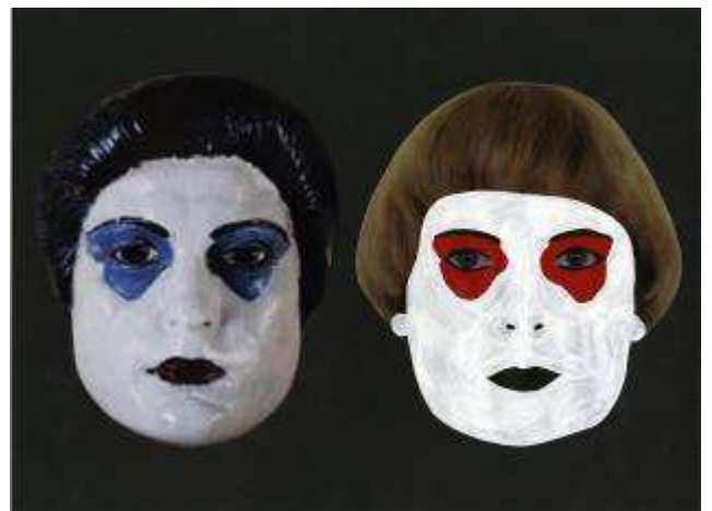
Karina Bisch, "I'll be your mirror", 2006, Papier, peinture, adhésif, 29,7 x 42 cm, Courtesy Karina Bisch