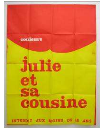
Clément Rodzielski, "sans titre", 2009, Peinture à la bombe sur affiche vintage, 120 x 160cm