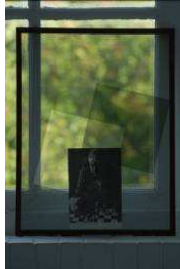
Mark Geffriaud, "Mire (Gombrowicz)", 2008, Page de livre et filtres noirs encadrés de deux panneaux de plexiglas, 56 x 43 cm, Courtesy gb agency, Paris, Photo: Christelle Montaron, IrmaVepLab