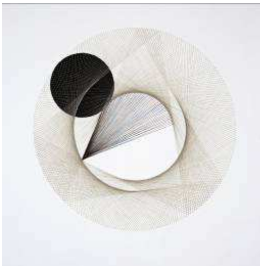
Sophie Bueno-Boutellier, "Cosmic time no. 005" 2009, Laine, tissu, punaises, 135 cm diam, Courtesy Galerie Carlos Cardenas, Paris / Circus, Berlin / Chert, Berlin, Image : Circus, Berlin