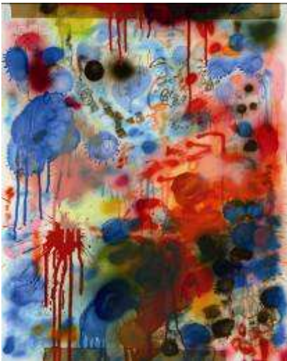
Ida Tursic & Wilfried Mille, "Vintage 3D 1", 2008, Jet d'encre sur toile, 250 x 200 cm, Collection CFDR, Paris, Courtesy Galerie Pietro Spartà, Dijon